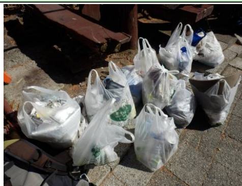
午前中だけで大量のごみが見つかりました