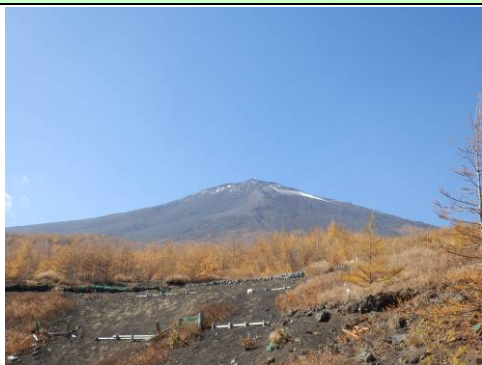
カラマツの紅葉が美しい富士山ですが…

以前よりごみが減っていると言われる富士山ですが、まだまだマナー啓発が必要です。会員の皆様も、機会があるごとに富士山を訪れる方へ呼びかけていただきたく、お願いいたします。