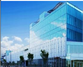
(プラサヴェルデ 外観)