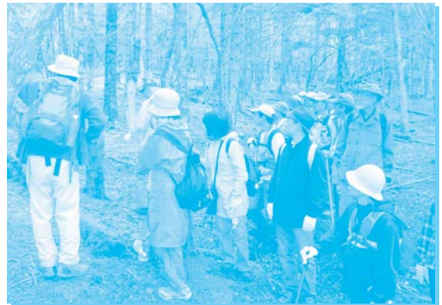
人工林を観察する参加者