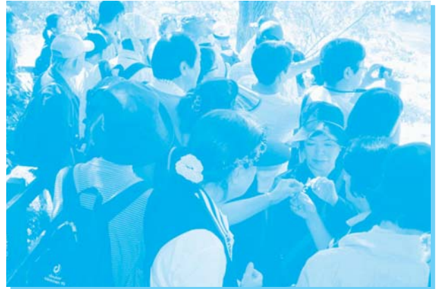
実際に手に取って観察する参加者