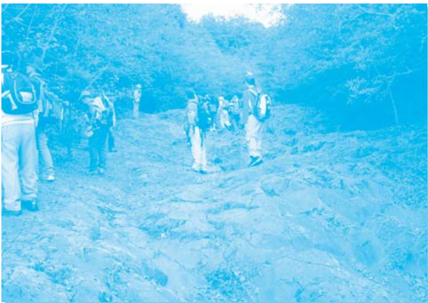
幕岩溶岩流の解説