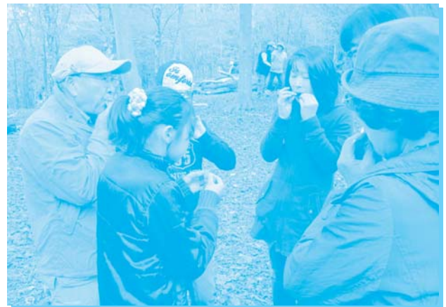
案内役の方から草笛の吹き方を 教えていただきました。

参加者の皆様からは、「大変よかった」という声が数多く寄せられました。 関係者の皆様には、3コースとも無事開催できたことを心よりお礼申し上げます。 ご協力ありがとうございました。