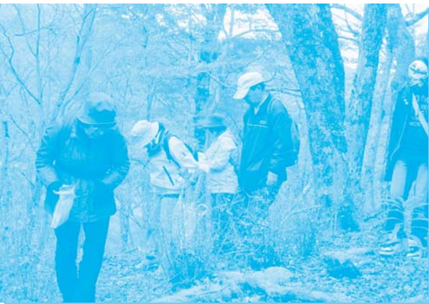
木の実を探す参加者