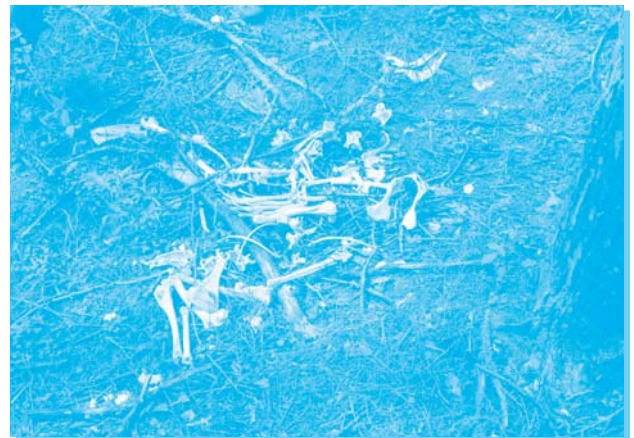
鹿の骨を見ることができました。