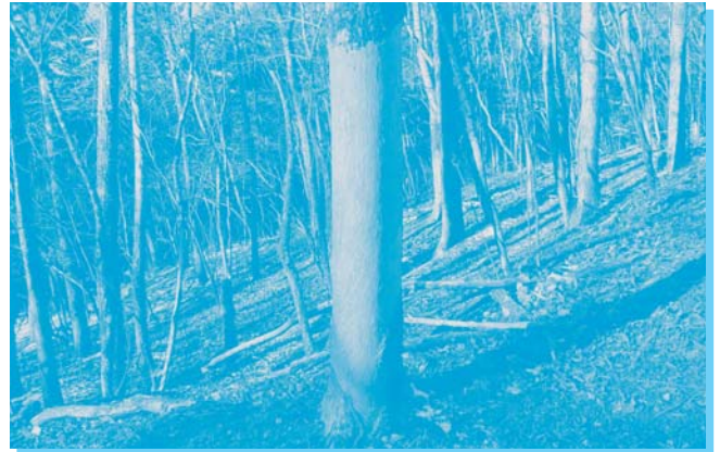
ニホンジカに樹皮を剥がされたキハダ (二合目付近)