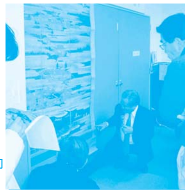
富士山の歴史・信仰 (富士曼荼羅の解説)