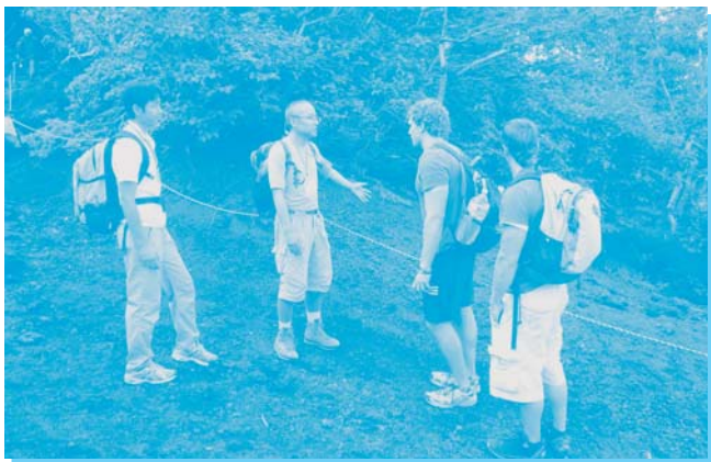
登山者へのマナー啓発の様子 (富士宮口登山道)