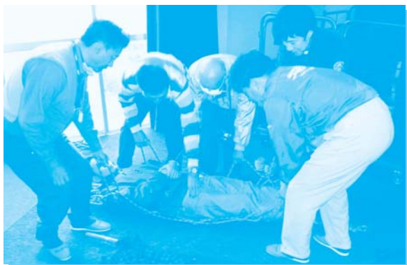
救助法の実践 (小山町須走支所)