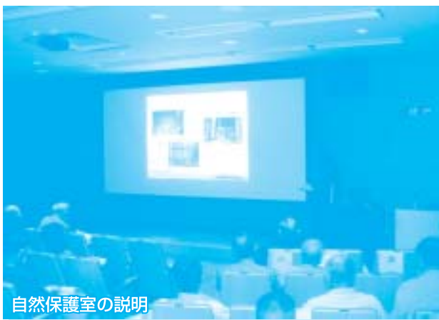
自然保護室の説明