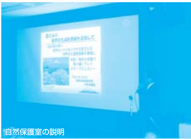
自然保護室の説明