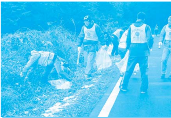
ごみを拾う参加者の皆さん

午前中は静岡県、富士宮市、静岡第一テレビ24時間テレビチャリティー委員会との共催で、清掃活動「富士山ごみ減量大作戦」を実施しました。公募ボランティア他スタッフを含め、約100名が4班に分かれて、国道沿いなどの道路脇に捨てられたごみを拾った結果、可燃ごみ170kg、不燃ごみ230kgを回収することができました。