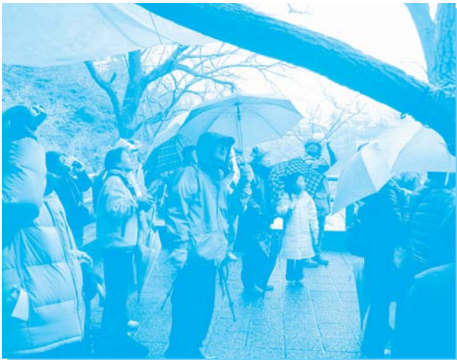
雨にもかかわらず、皆さん熱心に野鳥を観察しています。

小雨が降り続くあいにくの天気でしたが、コハクチョウ、カワセミ、シメなど33種類もの野鳥を観察することができました。