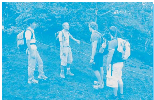
登山者へのマナー啓発の様子 (富士宮口登山道)