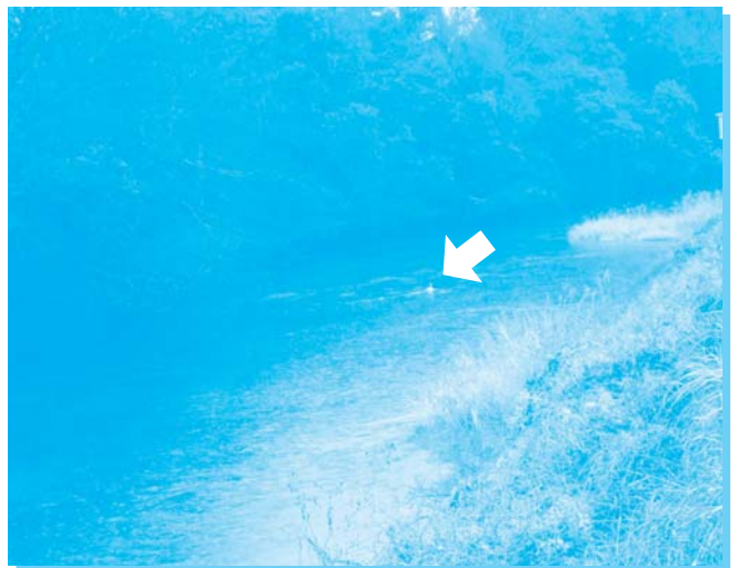
わかりますか? 普段見られないコハクチョウを見ることができました。

関係者の皆様には、雨にも関わらず、無事開催できたことを心よりお礼申し上げます。 ご協力ありがとうございました。