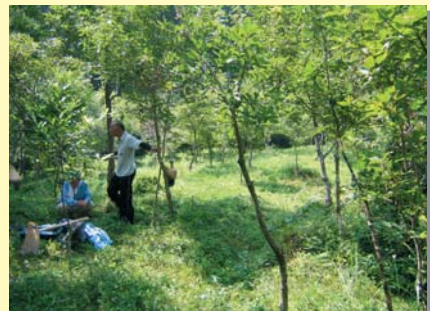
立派な森になりました

今では山野草やカブトムシ、栗の収穫等に加え、巣箱に入る小鳥の観察ができるなど、立派な森になっています(写真上から整備の状況)。