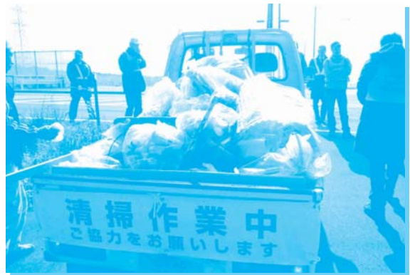
軽トラの荷台がごみで一杯になりました

午後は21名の会員が参加し、交流会を開催しました。日ごろの富士山環境保全活動の発表や情報交換を行いました。