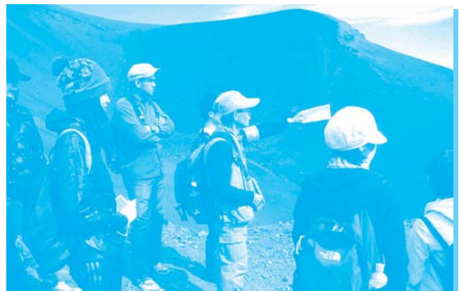
富士山クリーンアップ登山大作戦Ⅱ(静岡県)(静岡県)への協力 (宝永火口周辺)