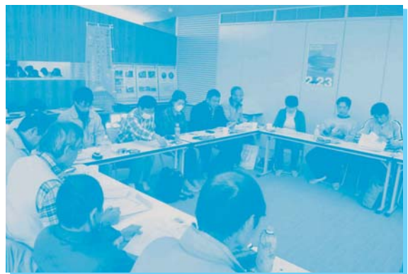
資料を見ながら、発表に熱心に耳を傾けています。

参加者、発表者の皆さん、ご協力ありがとうございました。 会員間での活動のコラボレーションを期待しています。