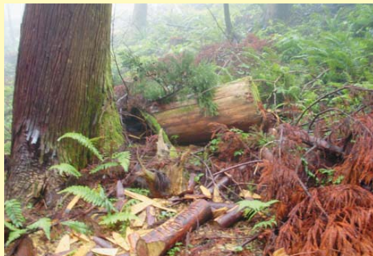
放置された間伐材

間伐材の中で建材にならないものは、その搬出費用がまかないきれないことにより、仕方なく放置せざるをえない現状があります。