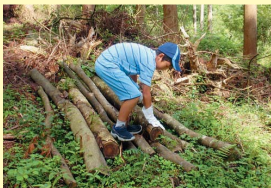
上手に切れるかな？

大人だけでなく、子供にとっても森林環境に親しみ、興味を抱けるイベントも開催しています。