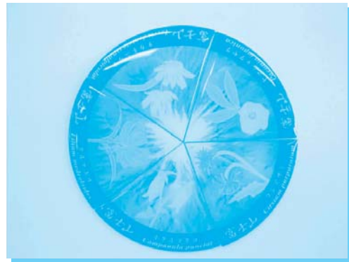
花シリーズ (5個セット・直径66mm) 1口 1,000円以上

募金に協力して下さる方は、事務局に、①お名前、②送付先住所、③電話番号、④希望するピンバッジの種類・個数をお伝えください。事務局から振込用紙を送付し、ご入金を確認でき次第、ピンバッジを送付します。なお、振込手数料及び送料は、ふじさんネットワークが負担します。