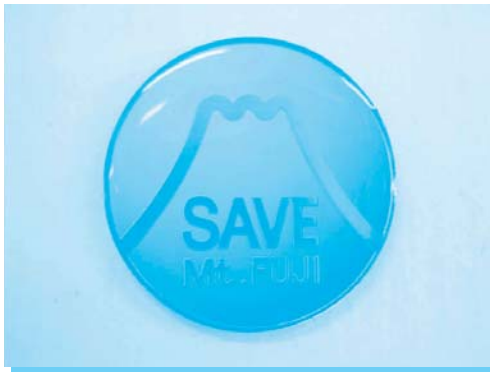
SAVE Mt.FUJI (直径26mm) 1口 300円以上

ふじさんネットワークでは、富士山の環境保全への協力を呼び掛けるとともに、環境保全活動を全国に向けてPRするため、寄付を募り、その記念品として、「富士山ピンバッジ」を配布しています。