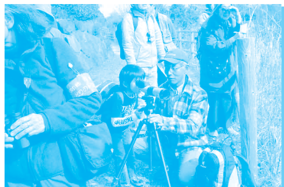
お子さんも熱心に野鳥を見ていました。