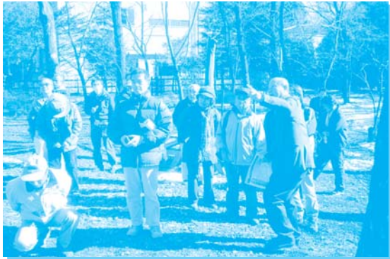
NPO法人土に還る木・森づくりの会 (森づくりの現場を説明している様子)