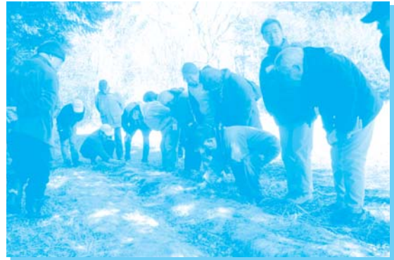
富士山ナショナル・トラスト (植樹用のドングリを植えた場所を見学)

各現場では、それぞれの活動について説明を受けたほか、植樹用の苗木づくりや森づくりの現場を見学しました。