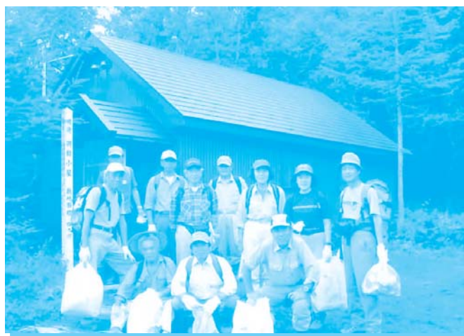
▲避難小屋となっている秀峰山の家

富士山須走口5合目上、国有林の借地に平成17年、会の創立45周年記念事業として老朽化していた避難小屋の改築を行いました。資金は会員カンパなどにより調達、建築は会員仲間の大工の棟梁を中心に、仲間が週末ごとに富士山に上がり手造りで完成させました。42㎡のロフト付き避難小屋には、だるまストーブを備え、富士山パトロールの拠点として、また冬山の避難小屋として使われています。