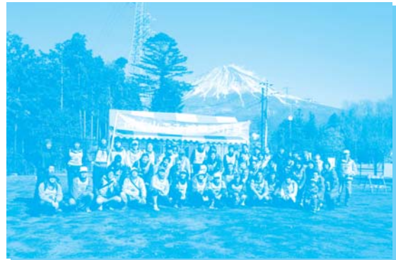
皆さん、お疲れ様でした