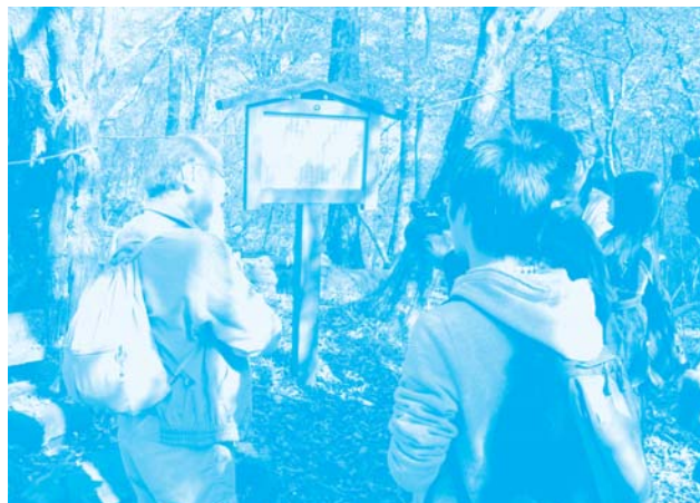
中国からの留学生へ自然解説中の様子