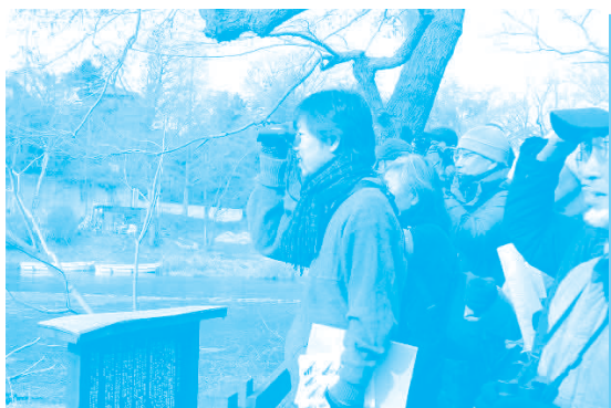
双眼鏡を手に野鳥を観察する皆さん

天气に恵まれ、カワセミ、ハクセキレイなど31種類もの野鳥を観察することができました。