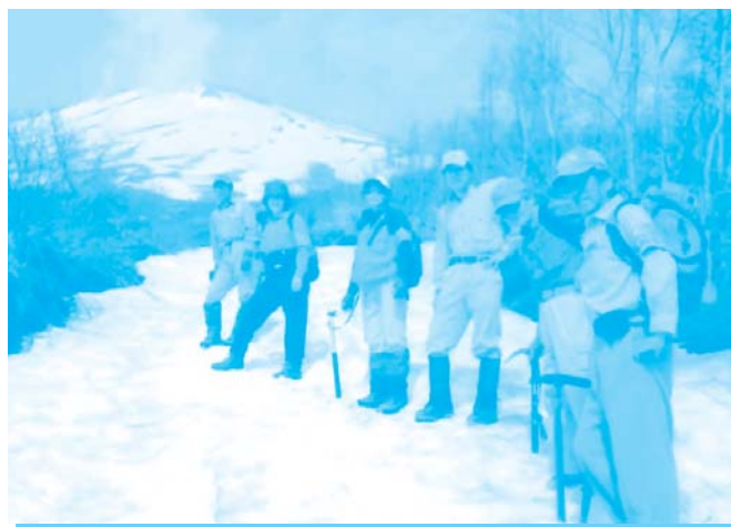
▲5月の富士山パトロール

主な活動は、山行事業として夏の一般募集によるバスハイク、環境保全活動として富士山美化清掃への参加、富士箱根トレイルハイキングコースの巡視・整備、遭難対策活動として冬山や5月のゴールデンウィーク時の富士山パトロールと幅広く活動を続けています。