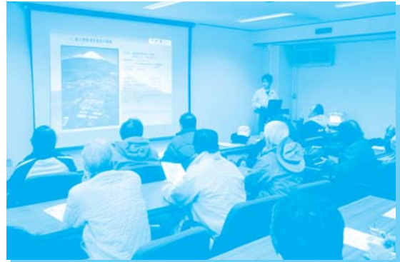
キリンディスティラリー(株) (富士山の恵みである水について説明している様子)

(1)～(3)の事業の関係者の皆様には、無事開催できたことを心よりお礼申し上げます。 ご協力ありがとうございました。