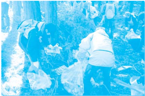
ごみを拾う参加者の皆さん