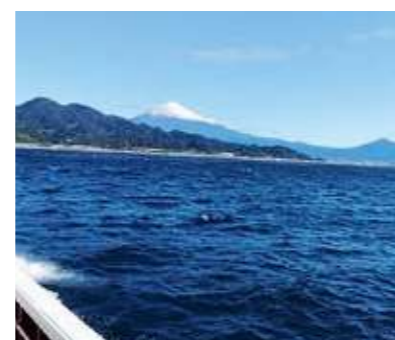
駿河湾から見る富士山

森や山のことを知れば知るほど、そこには多くの課題が見つかります。そして、直接その自然と関わりこととなる一次産業に従事する人が年々減少しています。私たちは、環境教育や自然体験活動により一次産業の魅力伝えること、そして自ら、林業や漁業や狩猟に従事して、そのリアルを学ぶことを大事にしています。そこには、資源の減少、野生動物の増加、気候の問題、環境の変化、人間生活とのバランス、政策による自然への影響等さまざま