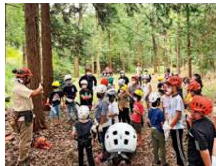
のこぎりでの伐採体験の様子

昔から山や川に入って遊んでいたことが多く、海と山と川、自然は全て繋がっていると自然と戯れながら感じていました。私たちの活動は主に森づくり活動が中心となります。森づくりには、多様な自然環境が開わるため、林業や里山整備などの森林保全活動にはじまり、狩猟を含めた野生動物対策、森林資源の利活用、自然体験や森林環境教育などの人づくり、漁業など、多岐にわたります。領域は広いですが、森の自然というものは山があり、川があり、そして海に繋がっているため、森づくり活動はさまざまな取り組みが必要となります。森なら森、山なら山、