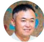
合同会社森のたね 代表社員