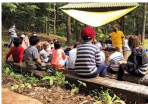
葉っぱを使って植物や森の話をする様子

けることや保護することを含めた自然との関わりを常に持つていないと、この先困ったことになると思います。鹿革が良い例ですが、鹿を狩らなくなると、鹿の捕り方を知る者がいなくなり、ひいては鹿革を鞣すやり方さえ後世に遺すことができなくなります。私たちの祖先が遺してくれた大切な文化が二つ途絶えることになってしまいます。