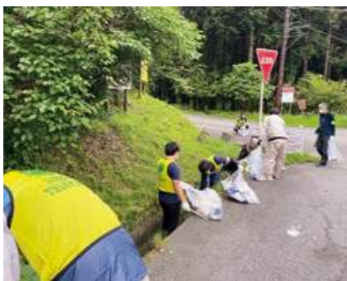
側溝のごみ拾いの様子

富士山ごみ減量大作戦は、ふじさんネットワーク、静岡県、地元市町及び静岡第一テレビ24時間テレビチャリティ委員会との共催で実施しており、令和4年度の第1回目を6月18日(土)に富士市桑崎で開催しました。新型コロナウイルス感染症拡大防止のため、一般ボランティアは募集せず、関係者のみでの実施となりました。