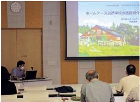
幹事による団体の活動発表

今後、更にふじさんネットワーク内外の連携を強め、富士山を保全する活動が活発に行われていくことが期待されます。