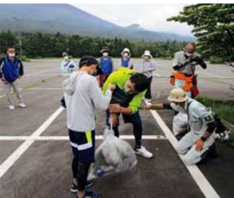
除去作業後の計量

政職員等の関係者による外来植物除去活動が行われており、『ハルザキヤマガラシ』をはじめとした外来植物が以前よりも減少しているのが視覚的にわかる状態の所もあります。今回除去したことによって、更に減少することが期待されます。