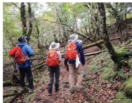
遊歩道をふさぐ倒木