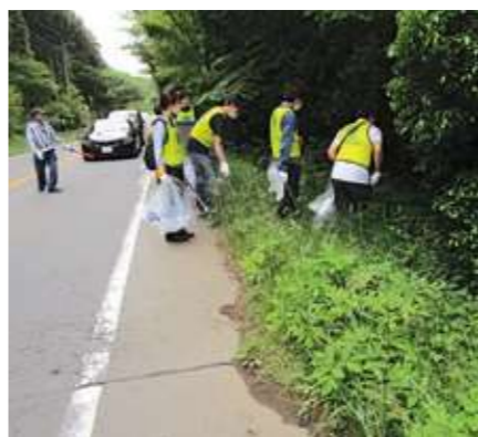
路肩のごみ拾いの様子

参加者21名で富士山こどもの国付近の道路(国道469号)沿いを清掃し、約40kg(可燃ごみ30kg、不燃ごみ10kg)のごみを回収しました。