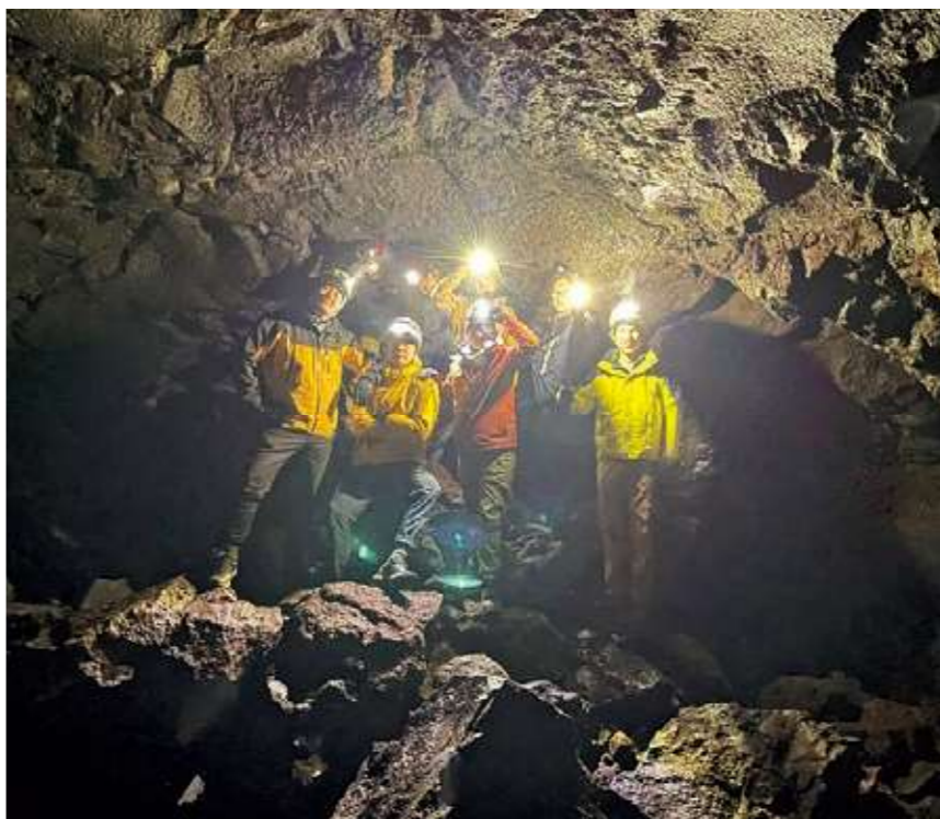
富士山麓に眠る洞窟を案内の様子

のでいいじゃないか。」という学生もいました。それぞれが自分の認識を深めてくれたように思いますが、植樹や野生動物を保護することに関しての認識は高い反面、木を伐採することや野生動物を殺すこと、自然の恵みを暮らして活かしていく認識や理解は低い部分もあるようです。私は、恩恵を受