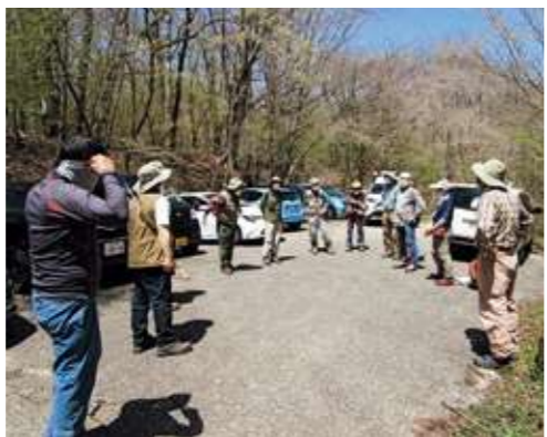
合同環境パトロール前のミーティング

富士山エコレンジャー連絡会(以降、連絡会)の総会は、令和2年度、3年度は書面開催でしたが、令和4年度は3年振りに対面で開催することができました。