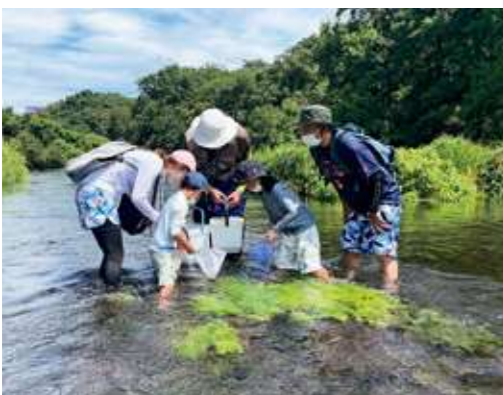
捕まえた生物の観察

夏の日差しの下でしたが、冷たい湧水に入りながら自然観察ができ、参加者の皆様にとって、思い出に残る夏の体験になったのではないのでしょうか。