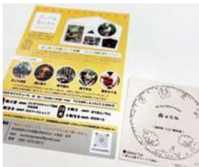
積極的に情報発信を始めている。(森のたねイベントチラシと案内冊子)

タッフが2名で、多岐に渡る活動を行っているため、内容ごとに専門家と協力しながら活動を続けています。継続的に、企業やNPO団体に森づくり活動の支援を行っており、ネットワークを作りながら、富士山麓での森づくりや自然体験活動をすすめています。私たちの活動はまだまだ小さい活動ではありますが、多くの人と一緒に森の中で過ごす機会をご一緒にしたいと思います。 また、富士山麓の森づくりは、私たちの拠点である富士宮だけでなく、静岡県内、さらには東京都内まで、いろいろな経験や考えを持った方が連携して知恵を出し合うことが、今後の活動をさらに活性化させる要素だと考えています。