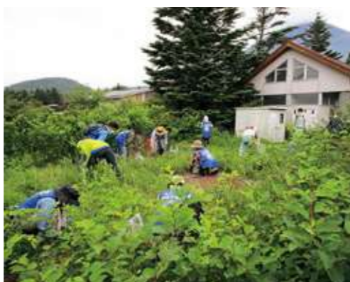
参加者の除去作業状況

今年度第1回目の外来植物撲滅大作戦を、7月3日(日)に水ヶ塚駐車場で行いました。