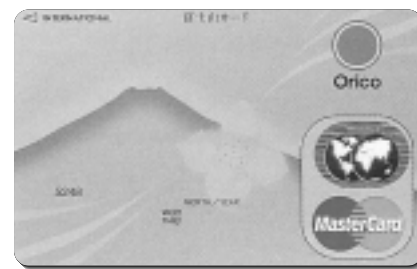
オリコ「富士山カード」