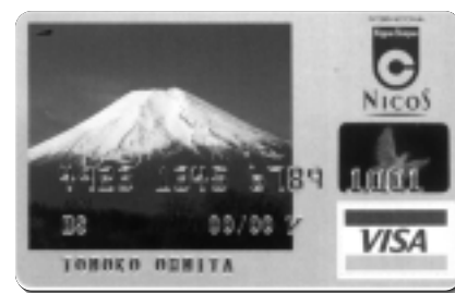
ニコス「ふじさんカード」

昨年より準備を進めてきた「ふじさん(富士山)カード」が出来上がりました。これは「ニコスカード」「オリコカード」と提携し実現したもので、カード利用代金の一部(利用代金の0.5%)が「ふじさんネットワーク」を通して富士山の環境保護活動に役立てられると共に、会員のみなさんの活動を応援するクレジットカードです。詳細については事務局にお問い合わせください。