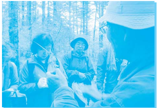
熱心にメモを取る参加者