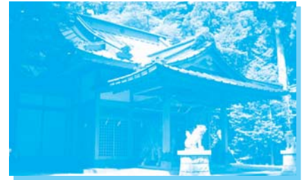
須山浅間神社（裾野市須山）

国の文化財（史跡）に指定されたことは、富士山の世界文化遺産登録の早期実現に向けて、また一步前進することができました。