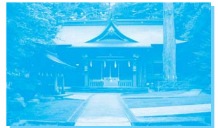
富士浅間神社（小山町須走）