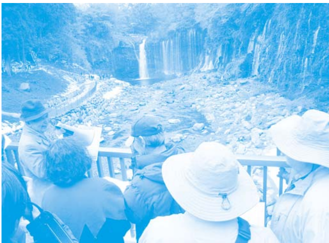
白糸ノ滝の前で説明に耳を傾ける参加者の皆さん

参加者からは、「白糸ノ滝のしくみなどについて詳しく伺うことができて良かった」「地元にいながらけっこう知らないこともあり、改めて勉強になりました」といった感想が寄せられました。