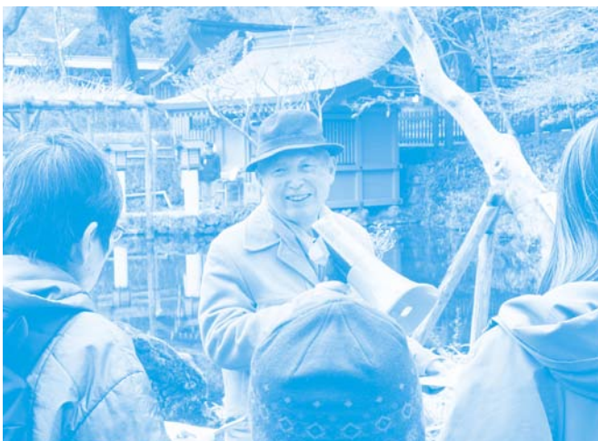
土 静岡大学名誉教授（湧玉池の前）