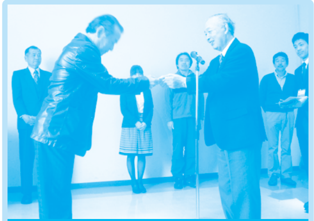
平成24年 富士山エコレンジャー認定式