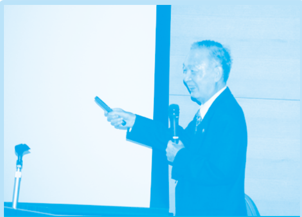
平成19年 ふじさんネットワーク総会