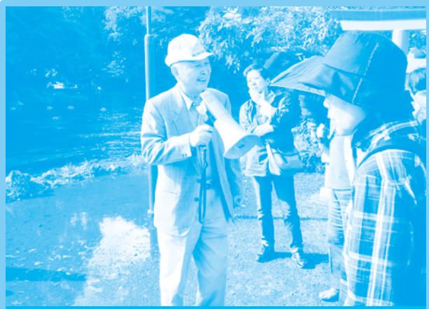
平成23年 富士山の湧水観察会