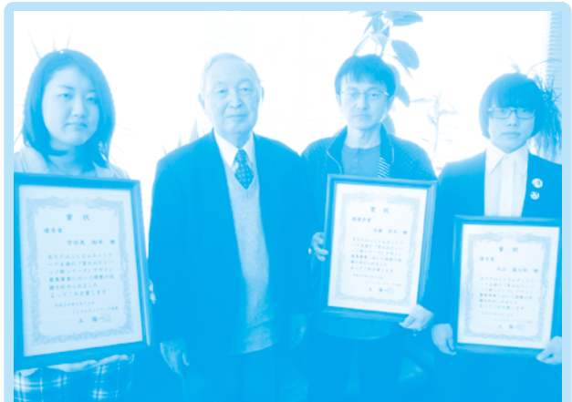
平成25年 富士山ピンバッジ新デザイン授賞式