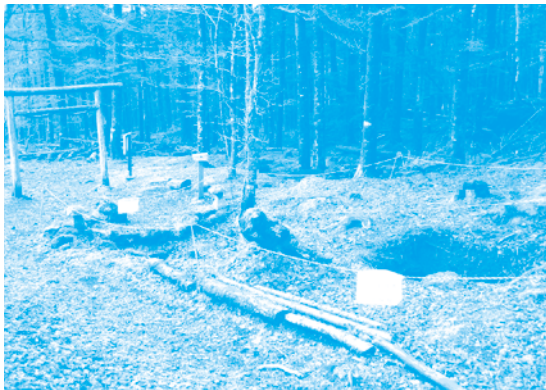
修繕前の崩落状況