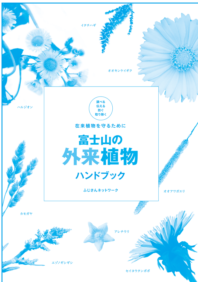
主要な外来植物を集めた表紙