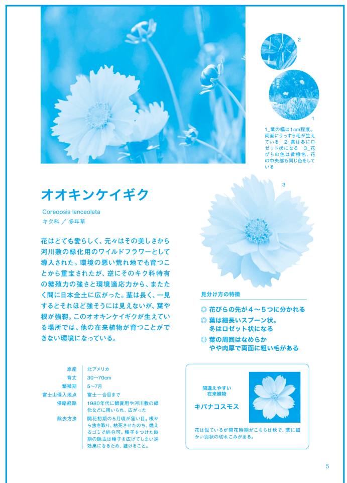
オオキンケイギクなど9種類の外来植物を解説