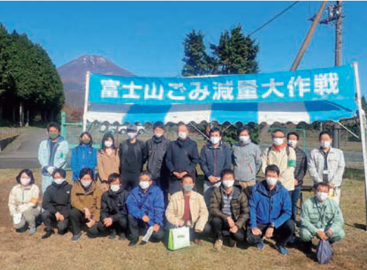
富士山を背に集合写真