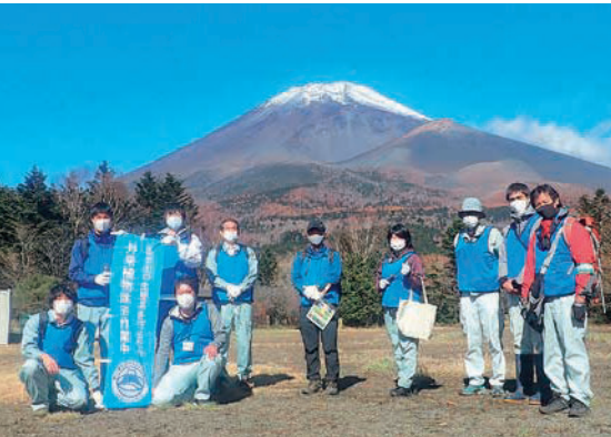
水が塚公園にて外来植物除去講習会を実施

開花時期ではありませんでしたが、地上部が枯死したエゾノギギシヤ、ロゼット状になっているハルザキヤマガラシなど、約7kgの外来植物を除去する事ができました。除去活動後は靴底の洗浄、使用した軍手の廃棄等を行い、外来植物の拡散に十分に配慮しました。