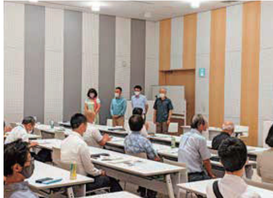
新たに就任した4人の幹事

役員の改選では、現行の会長、副会長、幹事の再任に加え、新たに4団体の代表者が幹事に就任しました。