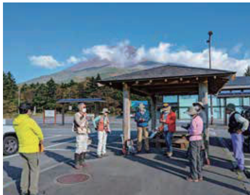
10月の合同環境パトロール

令和3年度富士山エコレンジャー連絡会(以降、連絡会)の総会は、昨年度に引き続き新型コロナウイルス感染症拡大防止のために書面開催となりました。