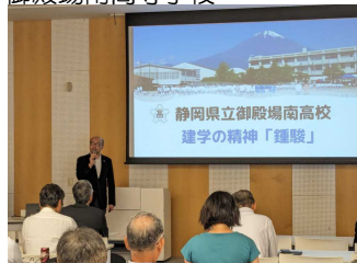
御殿場南高等学校